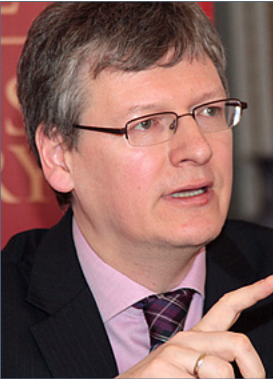
Andor László, az Európai Bizottság foglalkoztatásért, szociális ügyekért és társadalmi összetartozásért felelős biztosa