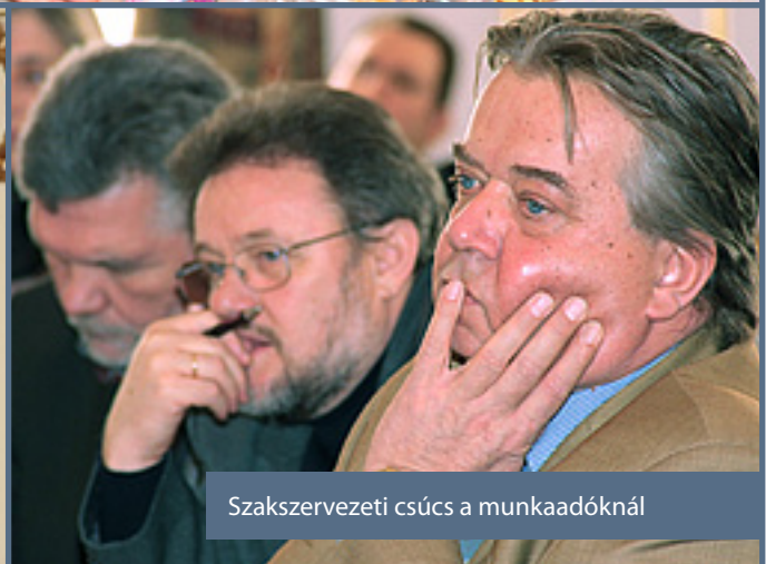
Szakszervezeti csúcs a munkaadóknál