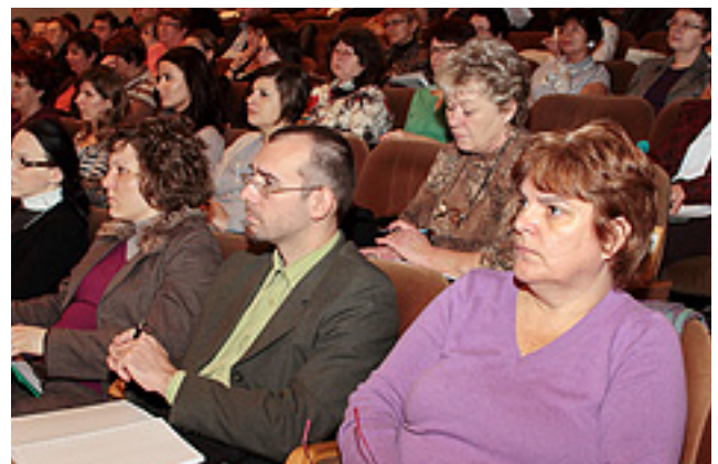
Telt ház volt a bérkompenzációs előadáson. A feszült figyelem azt jelezte, a vállalatok minden részletet tudni szeretnének, mielőtt döntenének, mit tegyenek