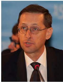
Varga Mihály, Magyarország pénzügyminisztere

Az 57. Közgazdász Vándorgyűlés záró plenáris ülésén, Nyíregyházán, Varga Mihály pénzügyminiszter több pontból álló javaslatcsomagot vázolt fel a magyar gazdaság további, fenntartható növekedése érdekében. Kiemelte: el kell kerülni a fiskális túlköltekezést, a tartalékok felélését, a mostani 25 százalékos beruházási ráta megőrzése mellett a munkaerő tartalékokat is mozgósítani kell. A forintárfolyamnak kiszámíthatónak kell maradnia, szükség van a szakpolitikai javaslatok végrehajtására, a kis- és középvállalati szektor ver-