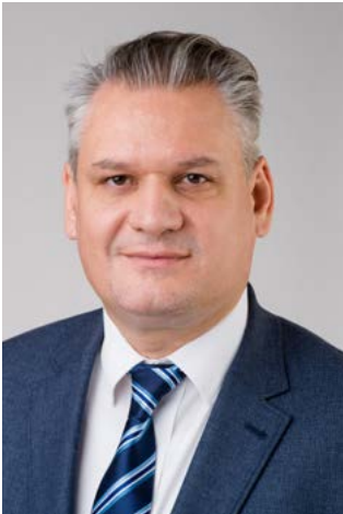
Takács Szabolcs, Brexit-ügyi miniszteri biztos