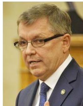
Matolcsy György, az MNB elnöke

„A Magyar modell 2.0 változatát 2019 és 2030 között kell végrehajtani, hogy Magyarország 2013 óta tartó, folyamatos felzárkózása a jövőben is folytatódjon”