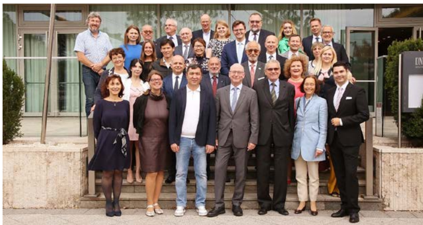
IOE – Európai és Közép-Ázsiai találkozó résztvevőinek csoportképe Budapesten

Az előzményekhez tartozik, hogy az első világháború befejeztével 1919-ben alakult az ILO International Labour Office Nemzetközi Munkaügyi Hivatal. A Versailles-i békeszerződés részeként alapították abban a szellemben, hogy általános és tartós békét, csak szociális igazságossággal lehet elérni. Ezt követően 1920 márciusában, jött létre az IOE International Organisation of Employers Nemzetközi Munkáltatói Szervezet, melyet eredetileg International Organisation of Industrial Employers, azaz Ipari Munkáltatók Szervezete néven alapítottak, mely szervezet kapcsolódott az ILO munkájához. Azaz a céllal jöttek létre, hogy védjék a munkáltatói érdekeket, erősítsék alku pozíciójukat és befolyásolják a kormányok újjáépítési terveit.